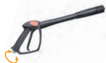
Pistolet GH 301 avec raccord tournant